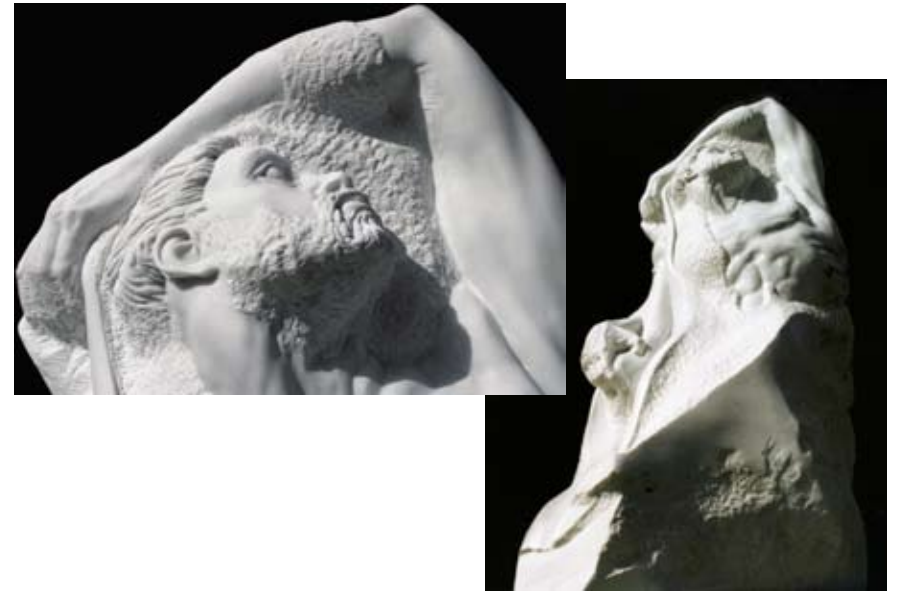
Impeto 激情 カッラーラ産白大理石 高さ 150 cm 1997 年