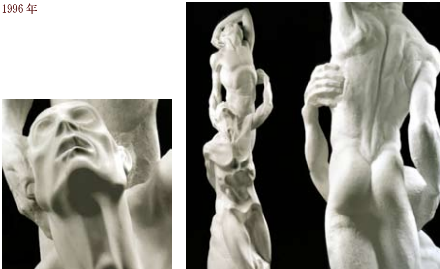
VOLTI 顔 カッラーラ産白大理石 高さ 200 cm 1996 年