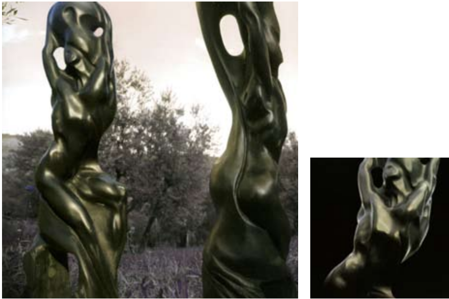
India インディア 粘板岩 高さ 60 cm 2008 年