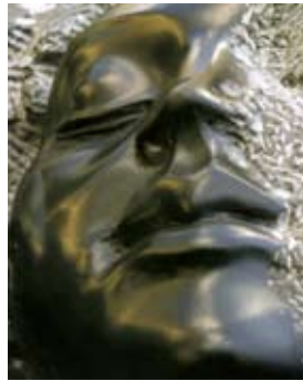
Omaggio di Dino Campagna オマッジョ・ディ・ディーノ・カンパーニャ 粘板岩 高さ 60 cm 2005 年 詩人ディーノ・カンパーニャに捧げた作品。