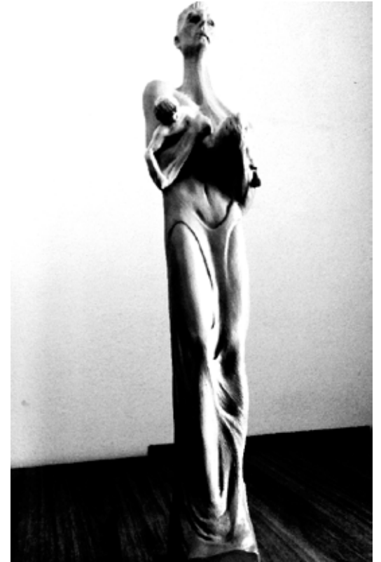
SIRIA... シリア 大理石 (予定) 250 cm