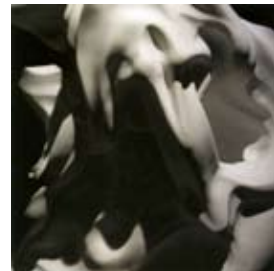
Omaggio di Fattori オマッジョ・ディ・ファットーリ カッターラ産白大理石 70 cm 2008 年 マッキア派の画家ジョヴァンニ・ファットーリに捧げた作品。