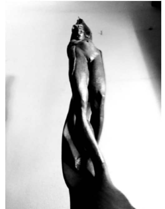
VELI ヴェール ブロンズ (予定) 250 cm