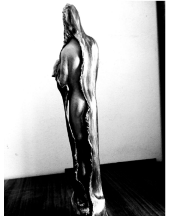
ANIME 魂 大理石（予定） 250 cm